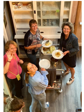
Op elke locatie wordt er dagelijks een gezonde en lekkere 3-gangen maaltijd gekookt.

Inmiddels kunnen we een heel kookboek samenstellen met recepten van onze koks en kokkinnen. Elke dag bereiden zij een verse, warme maaltijd voor. Elke dag maken ze er iets lekkers van waardoor het een feestje is om met elkaar te eten. Bij Onvergetelijk Leven hechten we veel waarde aan een gezonde maaltijd. We betrekken de deelnemers ook actief bij de voorbereidingen. Het ruiken van bekende geuren en het horen van vertrouwde keukengeluiden zorgen voor een huiselijke sfeer. Een belangrijk bijkomstig effect is dat vers gekookte maaltijden met meer smaak worden gegeten en dat dit de kans op ondervoeding verkleint.