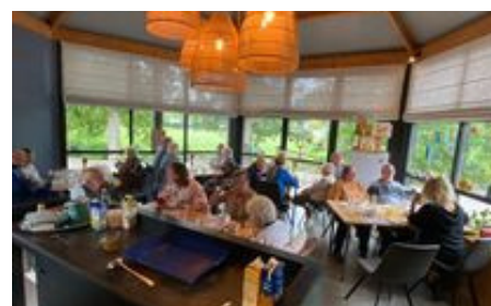
Foto 1 - 4: Tijdens de dagbesteding worden alle zintuigen geprikkeld en zijn deelnemers -in hun eigen tempo- alleen of met elkaar actief bezig. We spreken met elkaar een dagprogramma af zodat de dag voor iedereen zinvol en plezierig is.

Bent u mantelzorg van een van onze deelnemers? Wilt u een keer mee eten? Dat kan! U kunt zich aanmelden bij de betreffende vestiging.