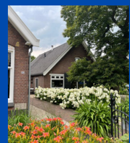
Linquenda Hoeve Holl. Rading

De cliëntenraad is bereikbaar per mail: clienraad@onvergetelijkleven.nl