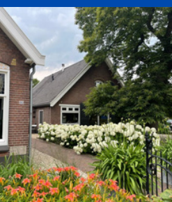
Linqenda Hoeve Holl. Rading

Bel 0348 34 21 23 of stuur een email naar info@onvergetelijkleven.nl