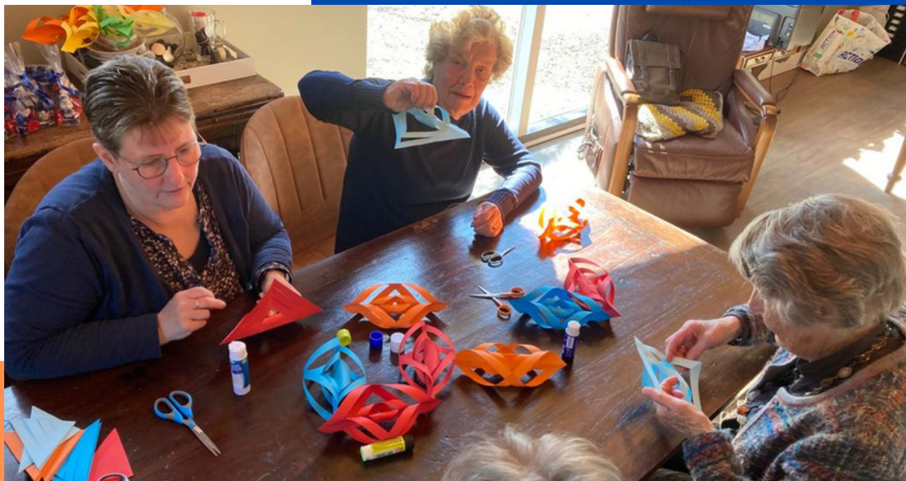
"Het leven is een feestje maar je moet wel zelf de slingers ophangen." Bij Onvergetelijk Leven maken we van elke dag een feestje en maken we zelf de slingers. Foto: deelnemers maken een slingerdecoratie voor Koningsdag.

Het voorjaar zit in de lucht en de eerste lammetjes zijn op locatie Allertijden geboren en geknuffeld. De in het najaar gepote bloembollen zorgen voor een kleurexplorie rondom de locaties. De natuur en zo ook onze tuinen kleuren weer groen. De tuinstoelen en het tuingereedschap worden weer meer en meer gebruikt. We worden er vrolijk van. Wat elk jaar ook weer een vrolijk moment is, is Koningsdag. Elke locatie viert het op zijn eigen manier. Bij Onvergetelijk Leven is iedereen koning en koningin en maken we met elkaar van elke locatie een paleisje. Wijzelf voelen ons de koning te rijk met ons team en de nieuwe ontwikkelingen die we met elkaar realiseren. Van elke dag een zinvolle en leuke dag maken. Dat is ons doel en de kroon op het werk.